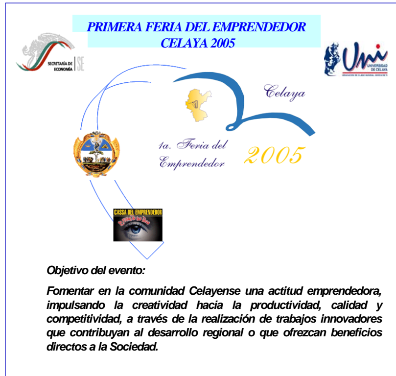
Figura 5-1. Afiche: Primera Feria del Emprendedor

Con la finalidad de impulsar la cultura emprendedora; a través del programa Cassa del Emprendedor, se organizó la Primera feria del Emprendedor Celaya 2005, con sede en la Universidad de Celaya los días 3 y 4 de mayo del 2005.