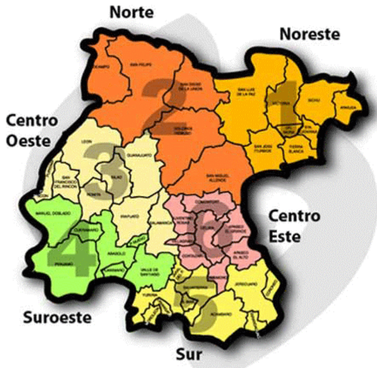
Figura 1-1. Ubicación geográfica

Guanajuato se encuentra dividido en 46 municipios de los cuales, para su mejor operación el Comité de Planeación para el Desarrollo del Estado de Guanajuato ha adoptado una regionalización que lo divide en seis regiones: