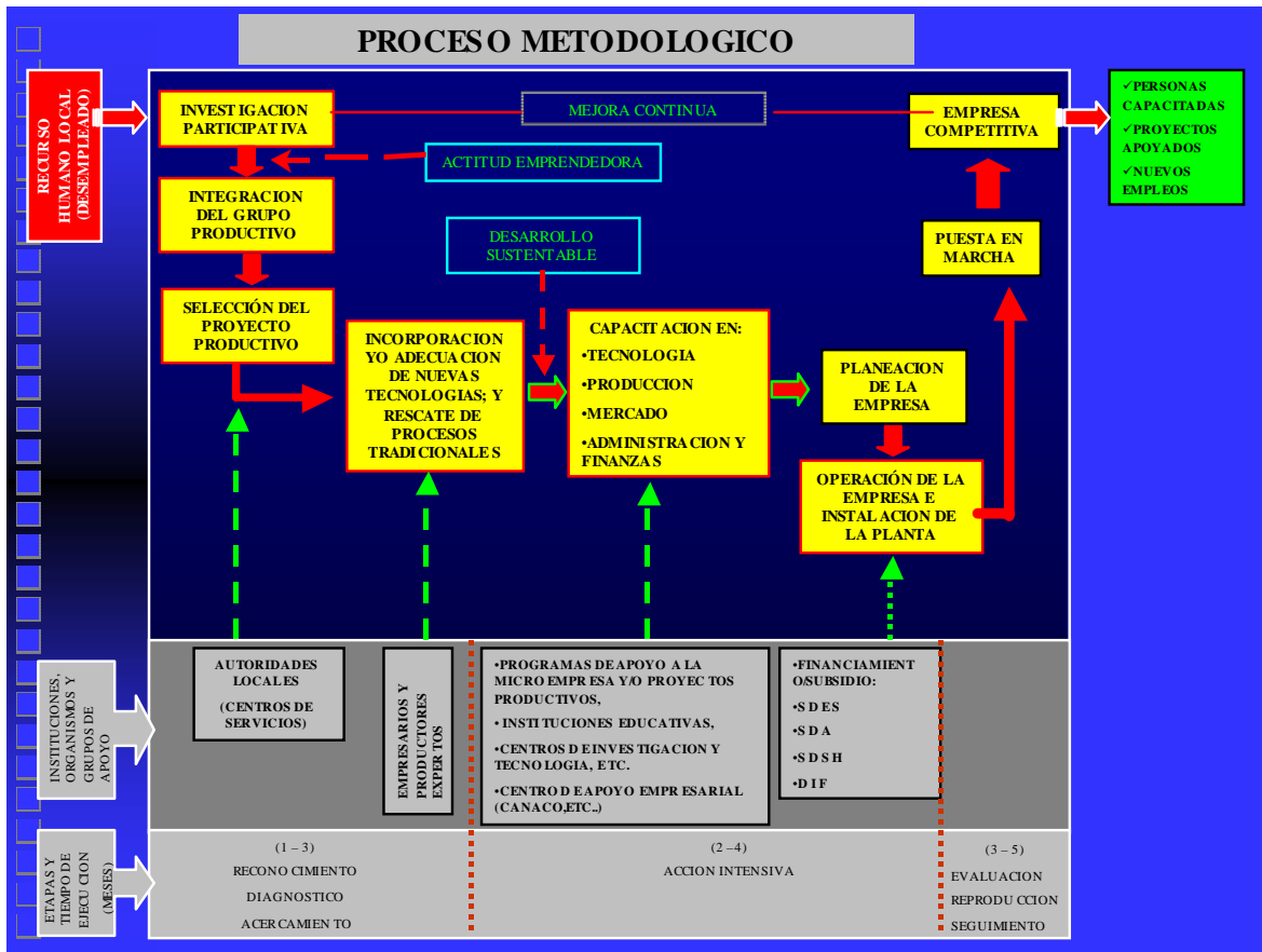
Figura 4-2. Proceso metodológico empleado en CASSA del emprendedor

El modelo conjunta un proceso sistemático integrado por ocho fases y la mejora continua. Se basa en el enfoque de la Metodología para la Planeación Participativa Comunitaria (PPC), cuyas etapas y principios influyen directamente en cada una de las etapas del proceso de creación de la empresa (Ver Figura 4-2).